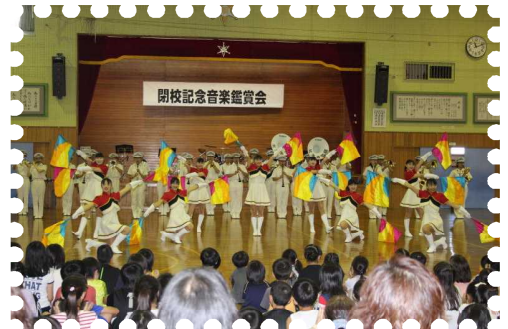
【道警音楽隊による音楽鑑賞会】

2学期最初の閉校記念事業は、道警音楽隊による「音楽鑑賞会」でした。大変すばらしい演奏と格好いいカラーガード（旗振り）に子供たちも大変興味をもち大きな拍手を送っていました。