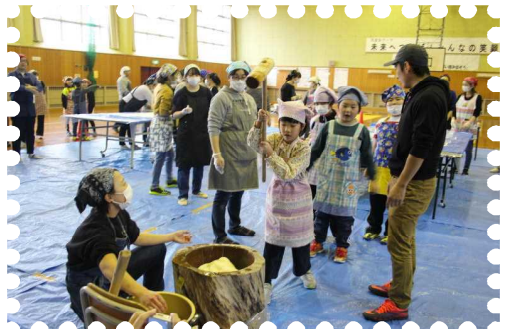
【閉校記念PTAもちつき大会】

12月には、PTA主催で「全校もちつき大会」を実施しました。PTAの役員さんが、全校児童に喜んでもらえる行事をしたいということで、総会で承認をもらい、何度も話し合いを行いました。初めてのことで心配もありましたが、地域や保護者の皆様のご協力により、子供たち全員が餅をつき、つくたての餅をおいしくいただくことができました。