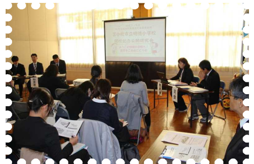
【閉校記念公開研究会】

11月には、「閉校記念公開研究会」を実施しました。道徳の教科化に向けて道徳教育の充実を目指した研究と実践を行い、その研究成果を発表いたしました。