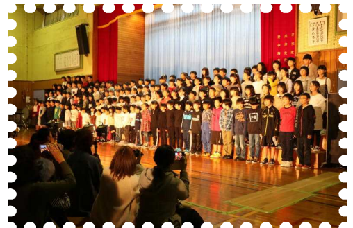
【閉校記念学習発表会】

10月には、2学期最大の学校行事、「閉校記念学習発表会」を実施しました。児童会テーマは「最後の学習発表会 みんなで協力して 響かせよう37年分のハーモニー」でした。子供たちは地域の方やお家の方に、感謝の気持ちを伝えようと一生懸命に頑張りました。温かな声援と拍手をいただき大成功で終わることができました。